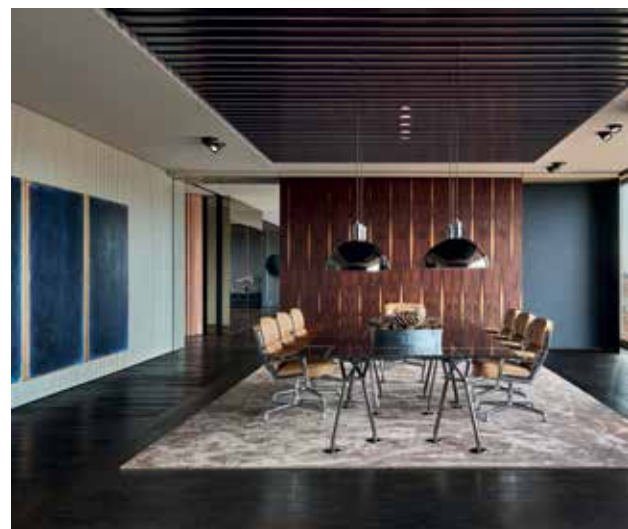
Poslovna zgrada Adris Grupe u Zagrebu