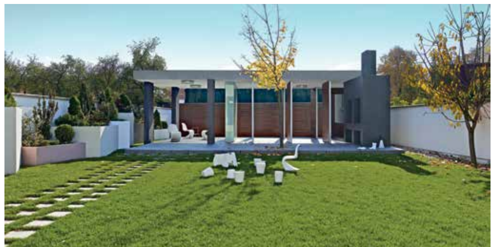
Vila Propuh, Osijek / Foto: Berislav Kovačević