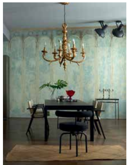
Stan u kući Šuflaj