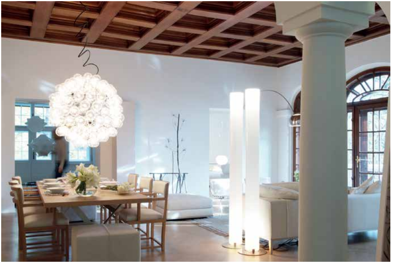
Stan u vili na Tuškancu

godišnjim klijentima s kojima sam se odlično razumjela pa sam bila slobodna predložiti im nešto potpuno suvremeno i na neki način konceptualno, a pritom, naravno, i funkcionalno. Tako je nastala Vila propuh, odnosno paviljon koji se sastoji od podesta i ravnog krova dok je između njih broj elemenata sveden na minimum. Ima samo kuhinju u toj "kutiji", stakleni kubus kroz koji prolazi dnevno svjetlo i panoe koji se vrte oko svoje osi. Ti panoi mogu formirati zatvorenu kuću u kojoj je kuhinja, a kada